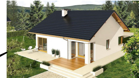
BUNGALOV - B14